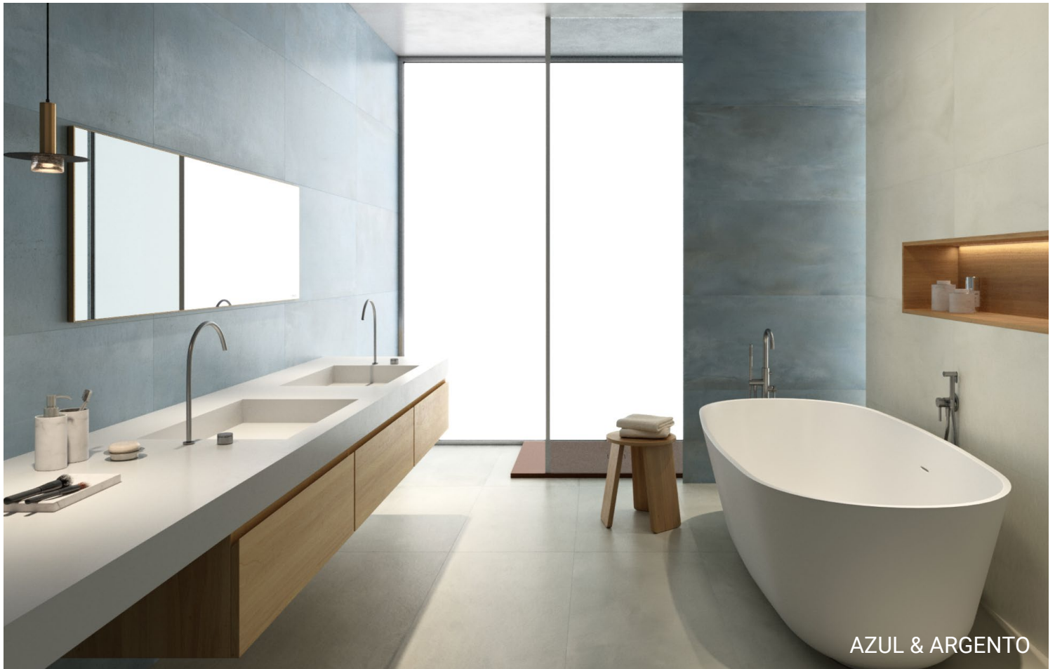
AZUL & ARGENTO