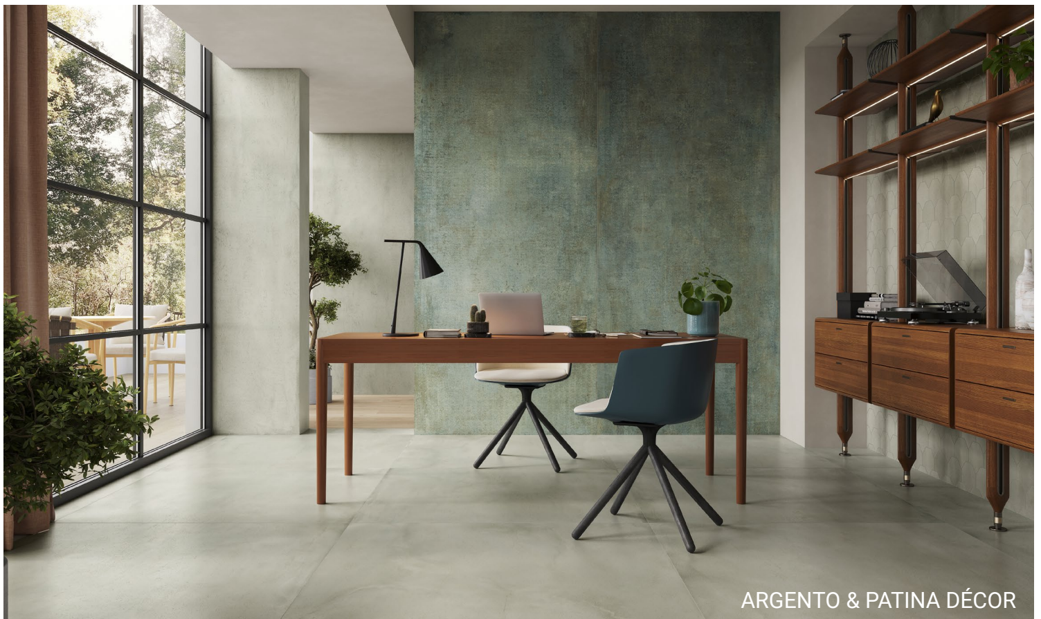
ARGENTO & PATINA DÉCOR