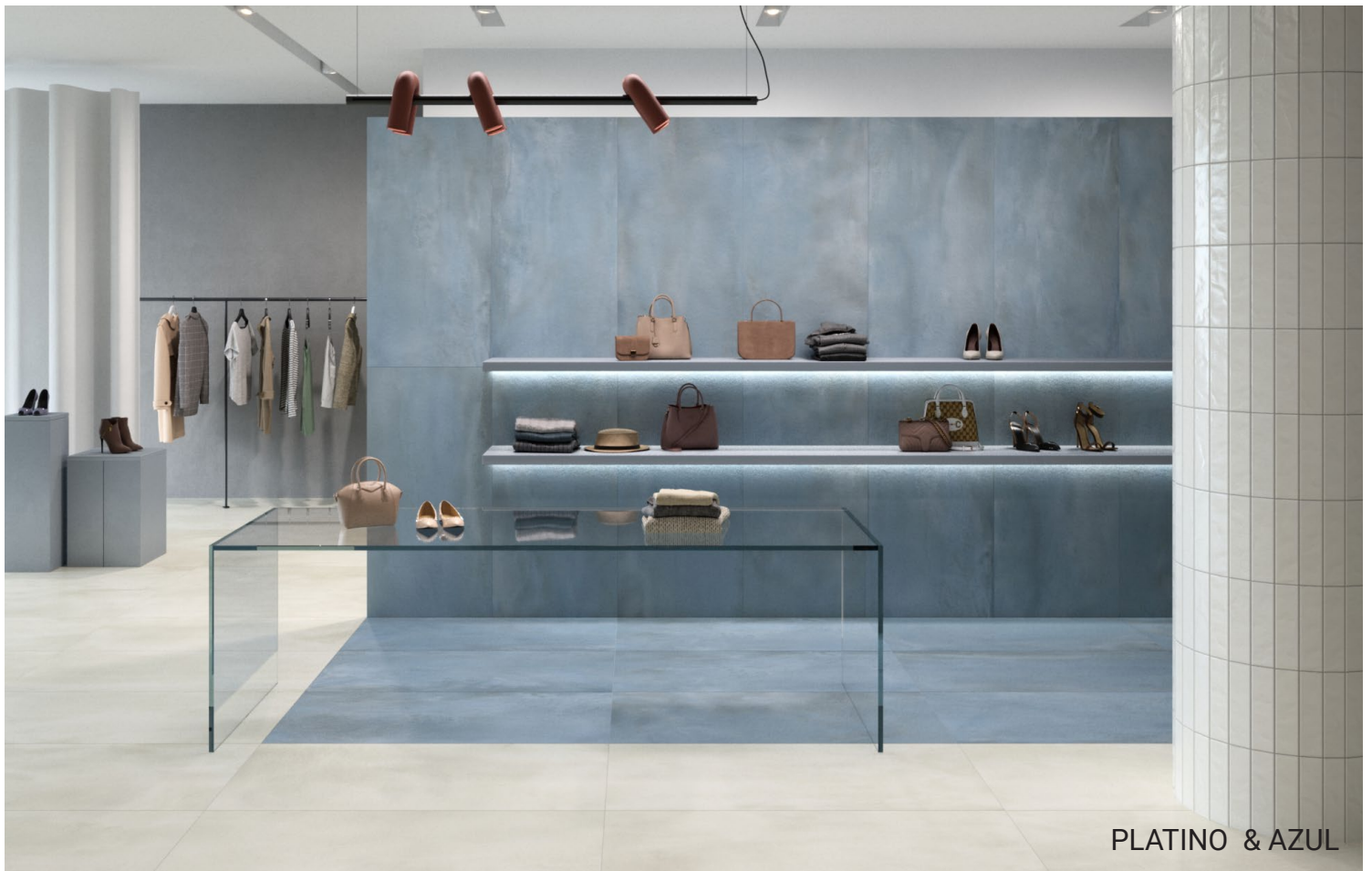
PLATINO & AZUL