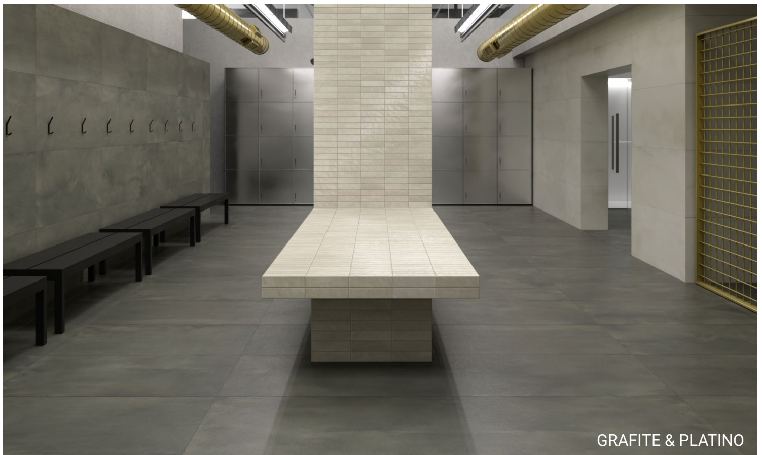
GRAFITE & PLATINO