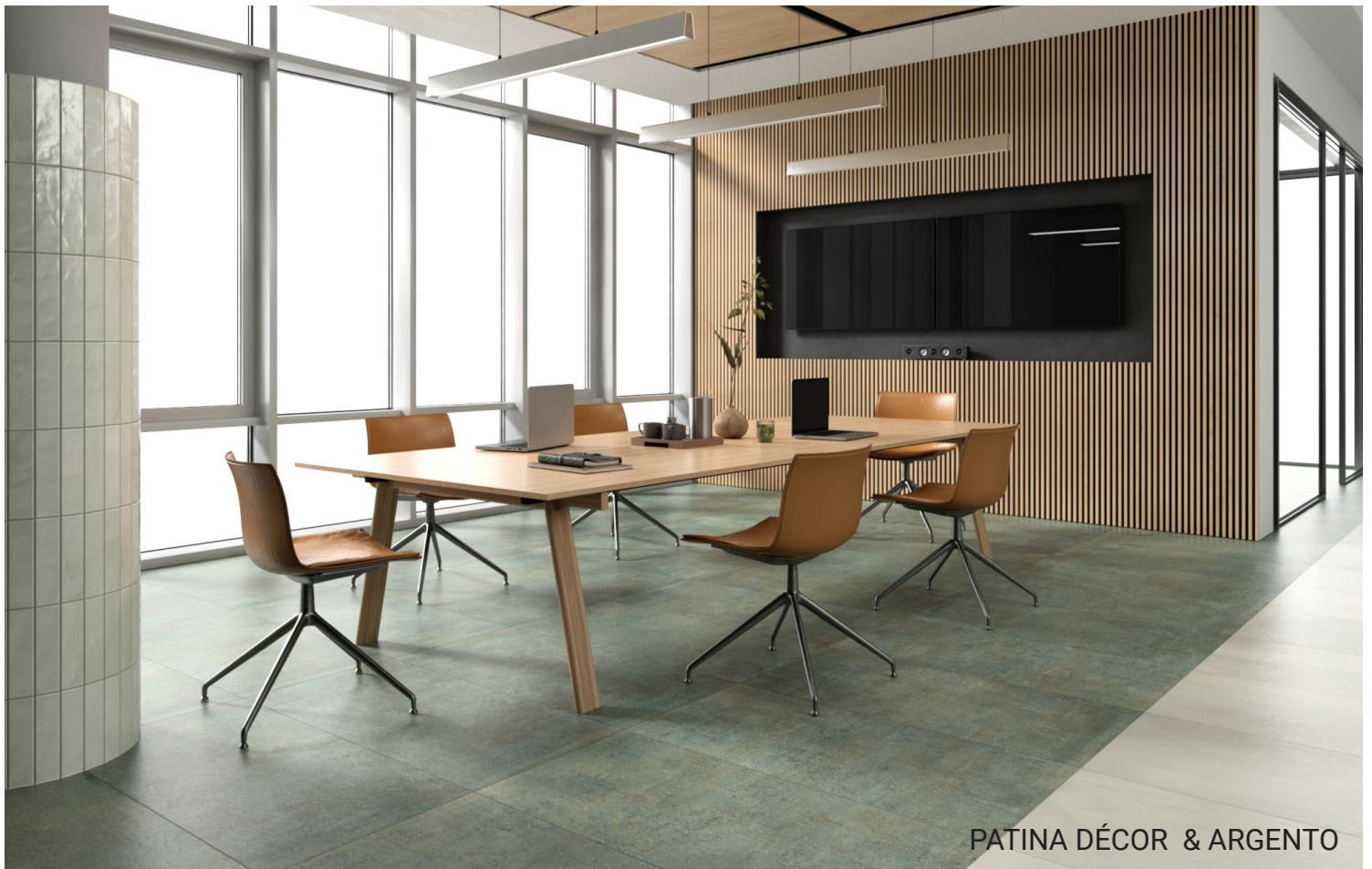
PATINA DÉCOR & ARGENTO